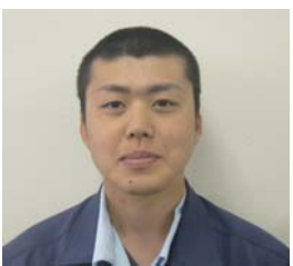
山城 大 やましろ だい 日特建設 株式会社

安威川ダム建設工事は大変工事期間が長い工事ですが、よりよいダムが完成できるよう努力しますので、今後ともご理解とご協力のほど、宜しくお願い致します。