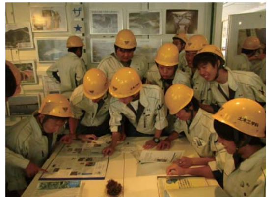
明石工業高等専門学校の学生のみなさん 資料館での様子