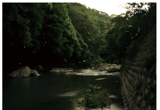
安威川でのホテル

平成二十七年四月二十六日より着任いたしました。現場監督として経験が浅いですが、地元である関西の一大ビッグプロジェクトに参加でき光栄です。大規模な工事重機に憧れ、