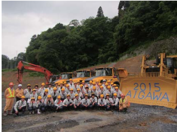
明石工業高等専門学校学生のみなさん