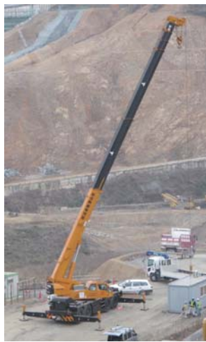
ラフタークレーン

今月の重機は六十トンラフタークレーンです。ラフタークレーンとは、クレーンにタイヤが付いた四輪駆動・四輪操舵が可能なクレーン車で不整地などを走行することも可能です。クレーン操作は同じ運転席で行います。走行時は最大速度が五〇キロメートル／時間なので、長距離の走行には不向きです。