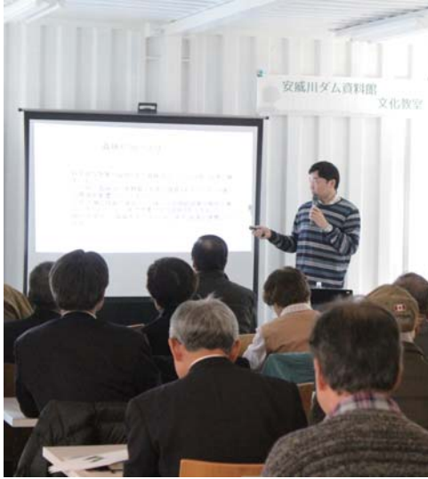
地域づくりの教室の様子