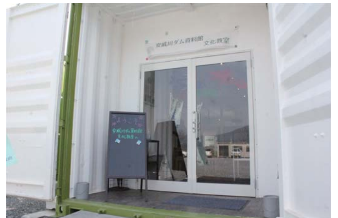
地域づくりの教室会場

また、日本の約六十か所で森林セラピー基地が広がっており（関西では和歌山県高野町、滋賀県高島市、奈良県吉野町、兵庫県六粟市の四か所）、世界的に見ても中国や韓国でも森林セラピーが広がってきていることが紹介されました。 安威川ダム周辺にも東海自然歩道といった豊かな森林が広がっている環境があります。皆様も足を運んで頂きまして、森林浴の効果を体感してみてください。 ※「森林セラピー」は特定非営利活動法人森林セラピーソサエティの登録商標です