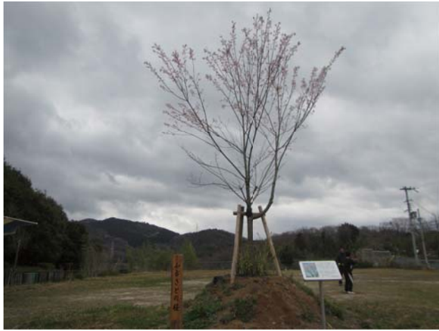
生保地区のヤマザクラ

昨年三月に生保地区・車作地区にて実施したヤマザクラ（エドヒガン）の植樹から、早いもので一年が経過しました。安威川ダム堤体付近から植樹された木々たちは地域の皆様の期待に応え、無事開花し、きれいな花を咲かせてくれました。工事の進捗と同じように木々も生育し、来年はより多くの花を咲かしてくることを期待しております。