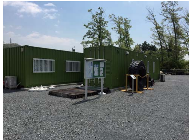
安威川ダム資料館

【開館日】平成二十八年五月十二日より 毎週木曜日 午後一時～午後四時 第三土曜日 午前十時～午後四時 ※但し、祝祭日、年末年始、盆休みは休館します。 また、工事の都合により臨時休館することもありますのでご了承ください。 【アクセス】 阪急茨木市駅より阪急バス89番「車作」行き 乗車「大門北」停留所下車徒歩十分 車での来場可能 (駐車場あり) 【問合せ先】 安威川ダムJV工事事務所 TEL072(648)5464 担当 東郷・辻